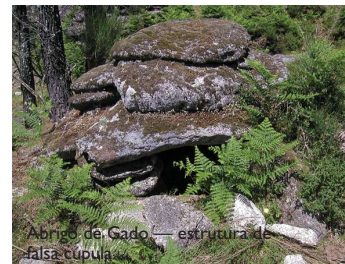
Abrigo de Gado — estrutura de falsa cúpula

Vale a pena espreitar atentamente o tipo de construção das edificações, da pequena rede de caminhos e dos próprios muros, testemunhos da forma equilibrada e harmoniosa de como a montanha foi sendo ocupada. Após esta paragem para visitarmos a branda, continuamos o percurso e desembocamos num caminho florestal, para pouco depois virarmos à esquerda e seguirmos um caminho que nos levará, em escassos minutos, ao lugar onde teve início este trilho por Terras do Soajo.