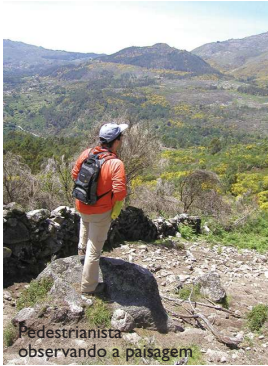
Pedestrianista observando a paisagem

O trilho de Ramil é um percurso pedestre denominado de Pequena Rota (PR), cuja marcação e sinalização cumprem as directrizes internacionais. Este percurso localiza-se na encosta nascente da Serra do Soajo, no extremo Este do concelho de Arcos de Valdevez, em pleno Parque Nacional da Peneda-Gerês, percorrendo parte significativa do lugar de Cunhas, da freguesia do Soajo.